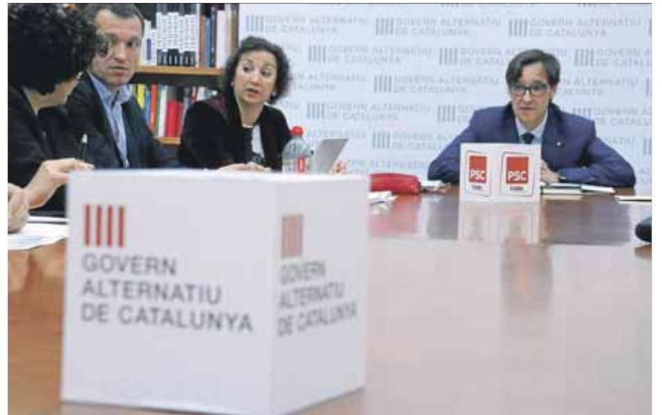
El grup parlamentari del PSC-Units, ahir, en una reunió al Parlament

Per la seva banda, la presidenta d'En Comú Podem al Parlament, Jéssica Albiach, va demanar ahir que "s'investigui a fons" l'escàndol, i va exigir que "s'assumeixin les responsabilitats que toquin". "Aquest no és un conflicte entre el govern català i el govern central, sinó entre l'estat profund i l'estat de dret", va concloure Albiach. ■