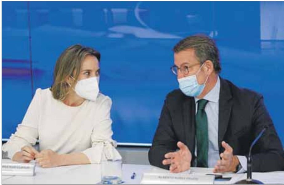
El líder del PP, Alberto Núñez Feijóo, conversa amb la secretària general, Cuca Gamarra, durant la reunió del comitè executiu de dimecres

El ministre de l'Interior, Fernando Grande-Marlaska, va negar ahir cap actuació il·legal de l'executiu espanyol, però va esquivar les preguntes sobre si haurà de comparèixer al Congrés per donar explicacions. De fet, ERC, JxCat, la CUP, el PDeCAT, Bildu, el BNG, Més País i Compromís han instat el president, Pedro Sánchez, que hi comparegui personalment, juntament amb els ministres de l'Interior i de Defensa i quatre alts càrrecs més, per ex-