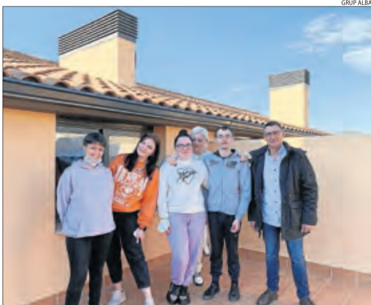
Els tres joves refugiats acollits pel Grup Alba a Tàrraga.

El consell va aprovar també una moció de suport a l'agricultura després de les gelades, que han representat pèrdues de 500 milions, i una altra de solidaritat amb Ucraïna. La comarca (Lleida ciutat al marge) acull seixanta-vuit famílies refugiades, amb dinou menors.