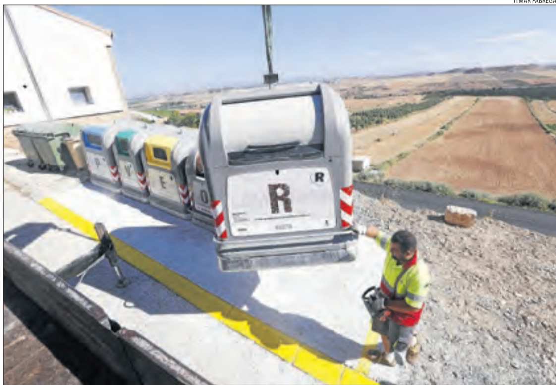
Un operari instal·lant els nous contenidors de recollida selectiva a Alfés el juliol del 2018.

L'UTE va informar de la seua intenció de no prorrogar el contracte a finals de l'any passat, per la qual cosa des de principis d'any es treballa en els plecs del nou concurs, segons va informar el consell. Va afegir que preveuen que entre el setembre i l'octubre estigui adjudicat el nou, per la qual cosa hi ha la possibilitat que l'actual servei es prorrogui unes setmanes més. Inclou els municipis d'Aitona,