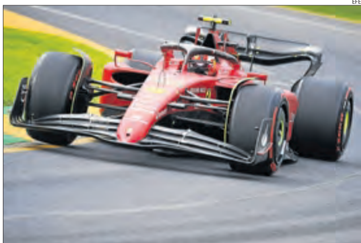
El Ferrari de Carlos Sainz, durant l'entrenament d'ahir.