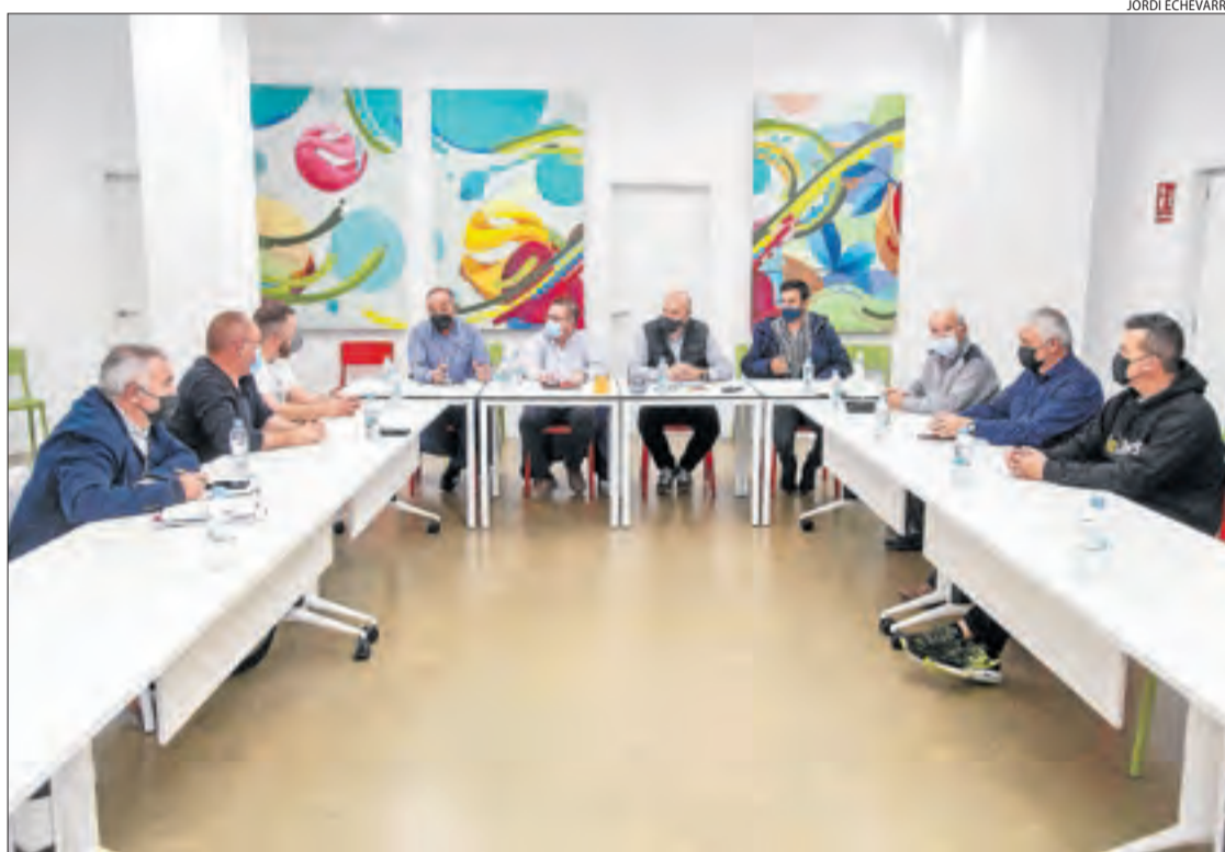
Imatge de la reunió feta ahir per la comissió Salvem la Pagesia a la seu d'Afrucat.

Finalment, veuen necessari que tant la Generalitat com Madrid creïn ERTO similars als utilitzats durant la pandèmia, per als treballadors fixos i fixos discontinus de les centrals fructícoles i les cooperatives. A més, la comissió va manifes-