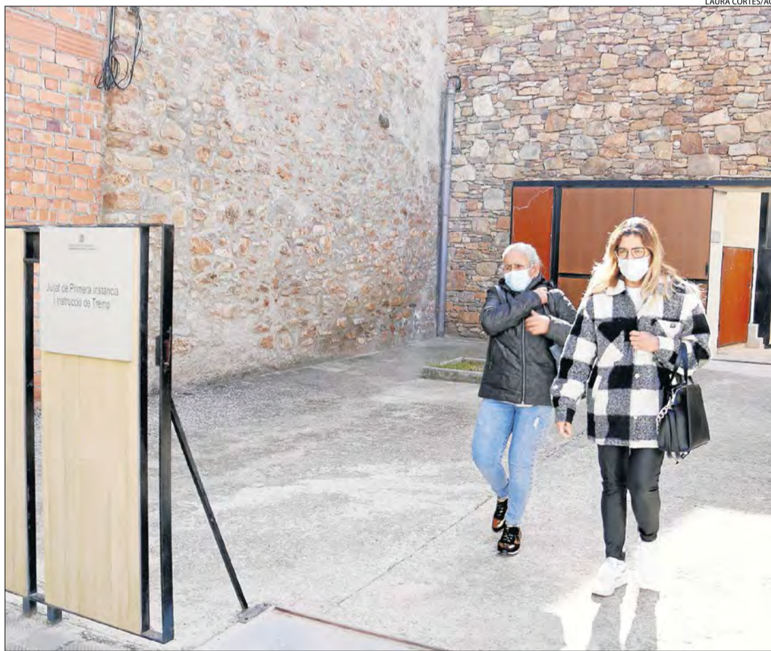
Treballadores de la residència Fiella ahir després de declarar al jutjat d'instrucció 1 de Tremp.