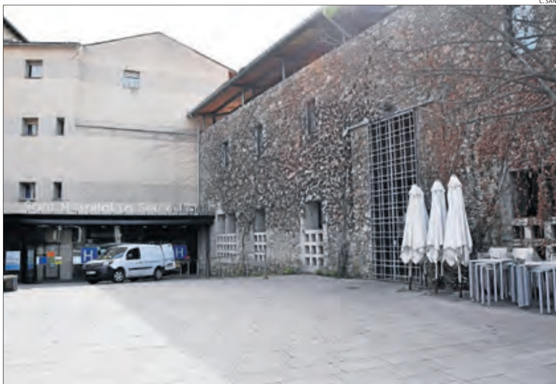
Imatge d'arxiu del Sant Hospital de la Seu, un dels centres que acolliran pràctiques.

Cadascun dels quatre cursos del grau tindrà un màxim de quaranta alumnes i s'aniran implantant de forma progressiva, de manera que el quart any hi haurà un màxim de 160 estudiants a l'any. Per cursar els crèdits pràctics, cada un d'ells haurà d'anar acompanyat d'un infermer professional. Complir aquests requisits exigirà distribuir l'alumnat entre els diferents hospitals del Pirineu, així com en centres d'assistència primària (CAP), consultoris mèdics i residències. Així ho van explicar ahir assistents a la reunió amb la conselleria d'Universitats, que es va fer a Tremp i va reunir representants