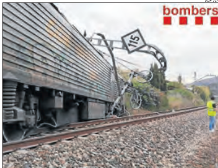
El tren descarrilat i danys a la infraestructura ferroviària.

L'accident, que va causar ferides lleus al conductor del tren de mercaderies i a un ajudant, obligarà a aplanar diverses zones per instal·lar grues de gran tonatge amb què es retirarà la locomotora bolcada. També s'hauran de traslladar els vagons que estan fora de