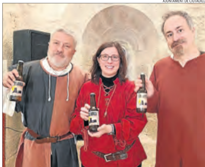
La cervesa que només es podrà provar al certamen.

Entre els actes previstos al programa per a la jornada d'avui dissabte destaca el concert de música medieval Cançons dels Pelegrins a càrrec de