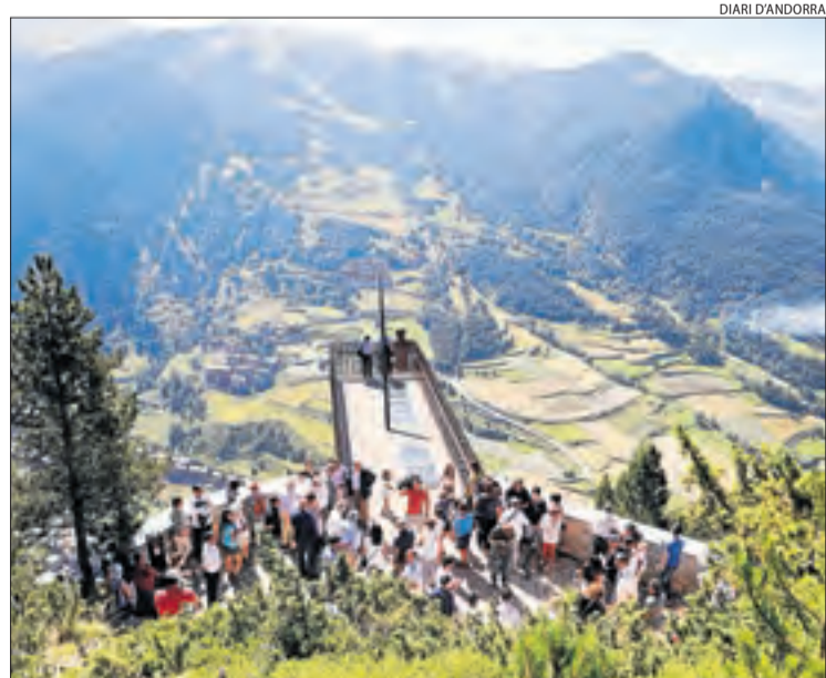
Imatge d'arxiu del mirador del Roc del Quer.

Buscar incentius i facilitats perquè els estudiants d'Infermeria es matriculin al grau que s'impartirà al Pirineu és una de les peticions dels alcaldes de les comarques de muntanya. Aquests denuncien des de fa anys la dificultat de cobrir les places vacants de personal sanitari i reclamen incentivar als professionals que prestin els seus serveis en municipis pirinencs.