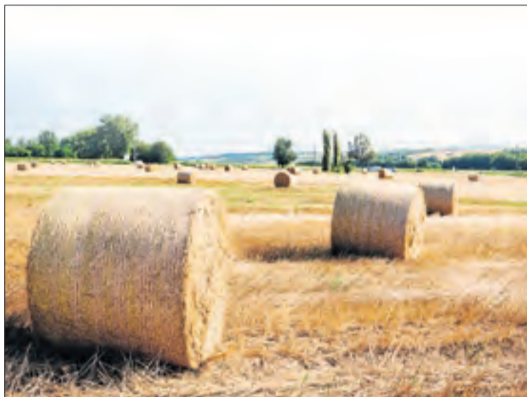
Es destina tant a l'alimentació humana com a la fabricació de pinsos.

La darrera campanya se saldava amb bons resultats en cultius com el blat, amb un increment d'un 25%, atribuïble a les pluges i bones temperatures que van millorar la producció i la qualitat dels cultius. En consonància, pujaven els preus i les vendes a l'estranger. Tant és així que el cereal adquirit per altres països creixia un 19,04% en va-