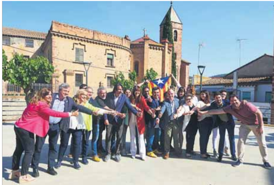
Foto de grup de la futura executiva de Junts, ahir, a Sant Climent de Llobregat

Junts, per escenificar la unitat del partit i reunir per primera vegada la candidatura –ja validada– per rellevar l'executiva actual,