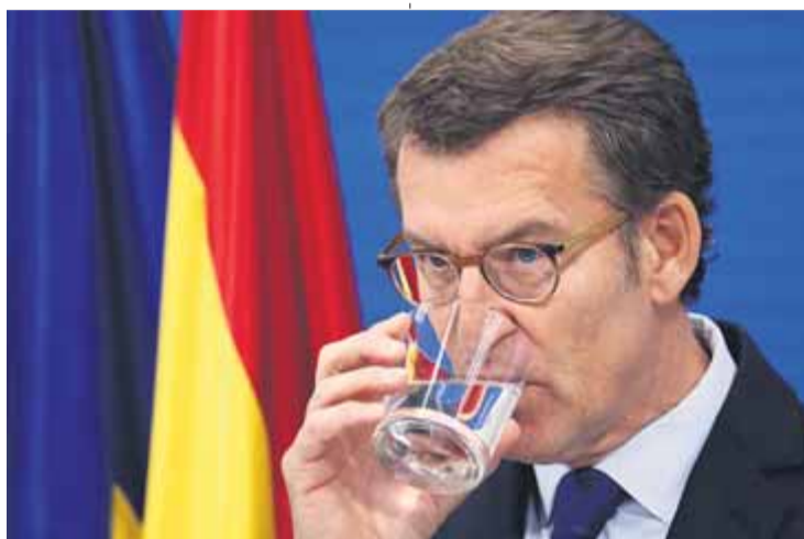
Feijóo ha hagut de dir que el PP exclou la plurinacionalitat

La frase de Bendodo no va merèixer ni tan sols el titular de l'entrevista —“Catalunya és una nacionalitat de l'Estat, com qualsevol comunitat autònoma”, va ser el titular elegit per El Mundo —, però la tempesta aviat es va desfermar. Una de les més