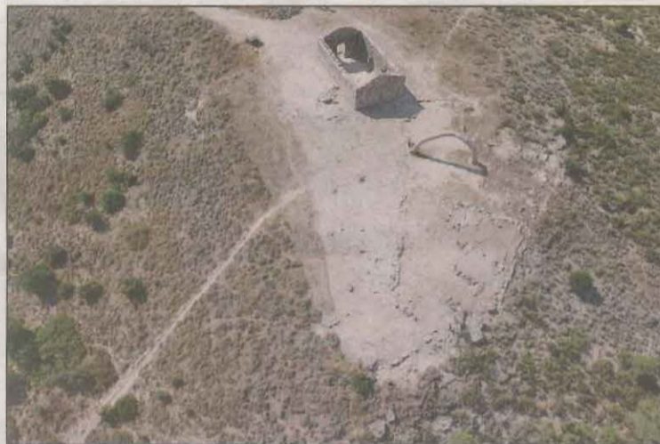
Imatge d'on es trobava el poblat del segle XIV

Tot sembla indicar que la construcció d'aquesta vila va modificar, com a mínim, dues ocupacions anteriors, una probablement andalusina, i l'altra, més antiga, encara per determinar,