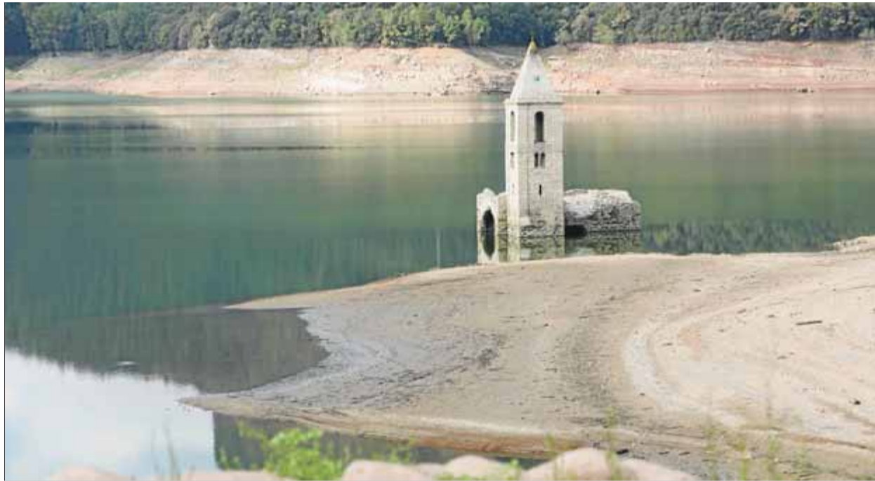
El pantà de Sau, amb l'església vella, en una imatge presa el 29 de juliol passat

El president de la Generalitat, Pere Aragonès, va destacar l'estat de les reserves als embassaments i va valorar que cal fer-hi front "amb serenor", però sense abaixar la guàrdia: "Hi ha entre 30 i 35 municipis on el subministrament depèn de la pluviometria. Estem al 42,3% de reserves als embassaments; això encara ens permet afrontar les properes setmanes amb serenor, però no ens