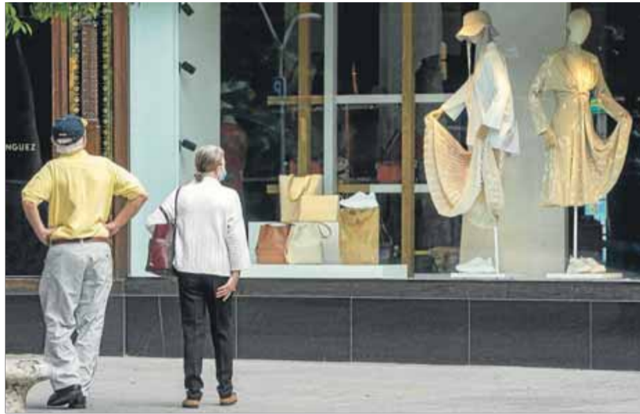
Aparadors com aquest del passeig de Gràcia hauran d'estar apagats a les deu de la nit des del 9 d'agost i fins a l'1 de novembre del 2023 d'acord amb el decret d'estalvi

Limitar el termòstat de manera unívoca era temut en algun sector com un risc per a les condicions laborals i una discriminació. “La norma té excepcions, es preservarà una climatització acord perquè els treballadors tinguin unes condicions climàtiques adequades”, va precisar la ministra d'Indústria, Comerç i Turisme, Reyes Maroto, tot citant l'exemple de les cuines dels restaurants i les zones dels súper on cal “mantenir la cadena de fred” dels aliments. En el cas dels hotels, la limitació afectarà les zones comunes i prou, i a l'habitació el client serà sobirà amb el termòstat.