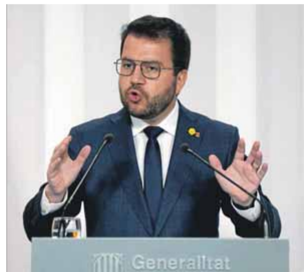
Aragonès, compareixent ahir davant la premsa

El president no preveu per al 2023 un escenari de recessió, però sí un ritme de creixement de l'economia inferior a l'actual. Per això, sense entrar en mesures concretes que deixa per a la negociació, avançava que no es tocarà la capacitat impositiva, però que el pressupost donarà resposta a "disrupcions" com la guerra d'Ucraïna, que ha fet disparar la inflació, i que la voluntat és "ser al costat de les famílies i em-