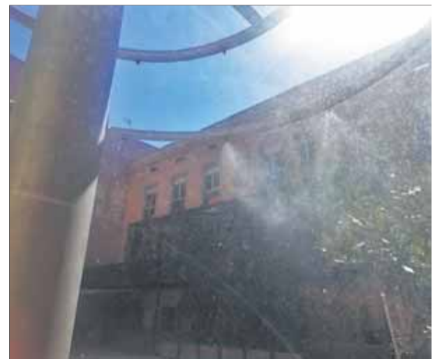
Un vaporitzador d'aigua al refugi climàtic del pati de l'escola Cervantes, al barri de Sant Pere de Barcelona