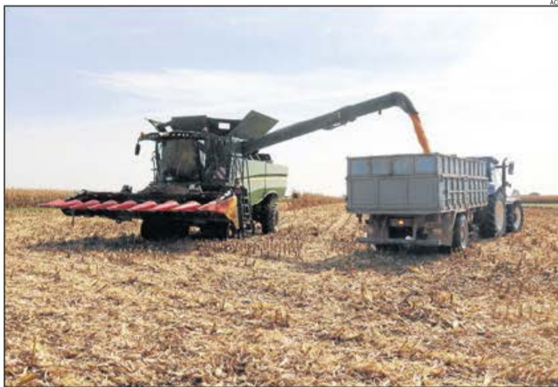
Imatge d'arxiu d'una màquina recol·lectora descarregant panís en un remolc.

Per comarques, el Segrià és la que compta amb més superfície destinada al cultiu del panís (14.410 hectàrees) i també amb la taxa més elevada d'OMG, a l'assolir el 61,60 per cent amb un total de 8.876 hectàrees. La segueix en superfície la Noguera (5.405 hectàrees i un 48,34