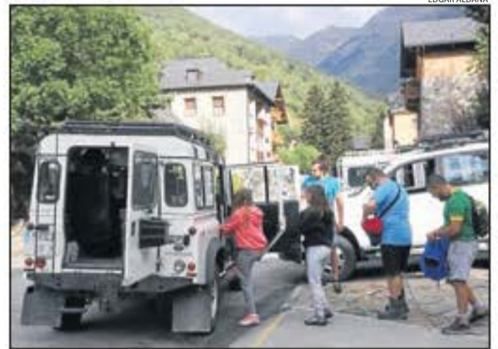
Els taxis d'Espot per visitar Aigüestortes, la setmana passada.