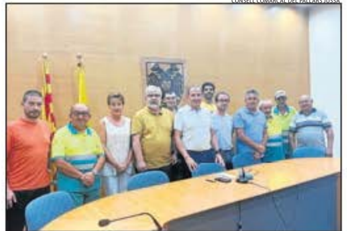
Membres del consell amb els beneficiaris del programa.