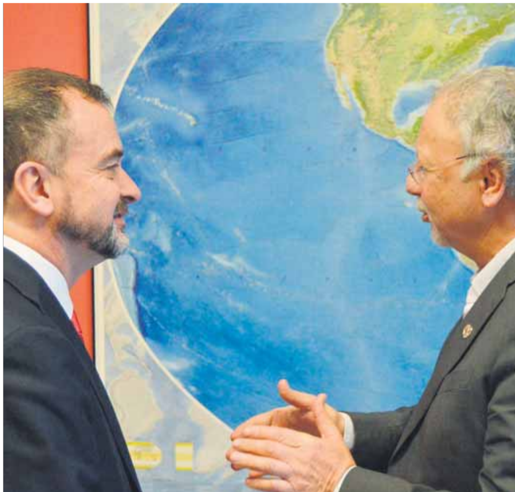
Varennes , en la visita del gener del 2019 a l'Estat en què es va reunir amb múltiples institucions i autoritats, com el llavors conseller Alfred Bosch

Diversos tractats, com el Pacte Internacional dels Drets Civils i Polítics del 1966 –el mateix pel qual el comitè de drets humans ha donat ara la raó a quatre expresos polítics a qui la justícia espanyola va treure l'acta de diputat–, recullen la necessitat de protecció dels drets de les minories ètniques, religioses i lingüístiques, uns drets que també contemplava i ampliava la resolució 47/135 de l'Assemblea General de l'ONU presa per consens el 1992. “I drets vol dir un seguit d'obligacions jurídiques als estats signants”, remarca González Bondia. Entre ells, així, s'obliga a protegir la identitat nacional o ètnica de